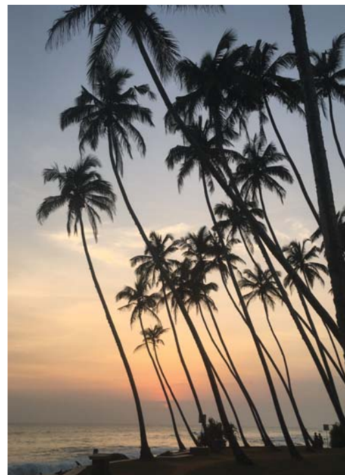
Sonnenuntergang über dem indischen Ozean