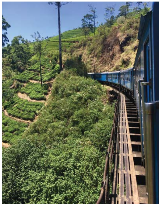
Eine Zugfahrt durch das Hochland und die Teeplantagen