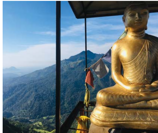
Eine Buddha-Statue am Gipfel des Little Adam's Peak