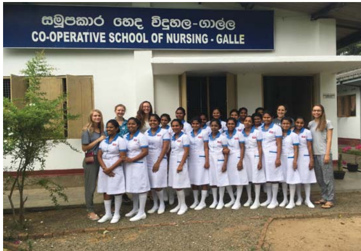
Wir Freiwilligen mit den Krankenpflegeschülerinnen

Schülerinnen viel Englisch redeten und uns auch beim Reden zuhörten, denn so lernt man eine fremde Sprache am besten... durch Ausprobieren. Unser physiotherapeutisches Wissen konnten wir beim Behandeln von medizinischen Inhalten auch gut gebrauchen und weitergeben.