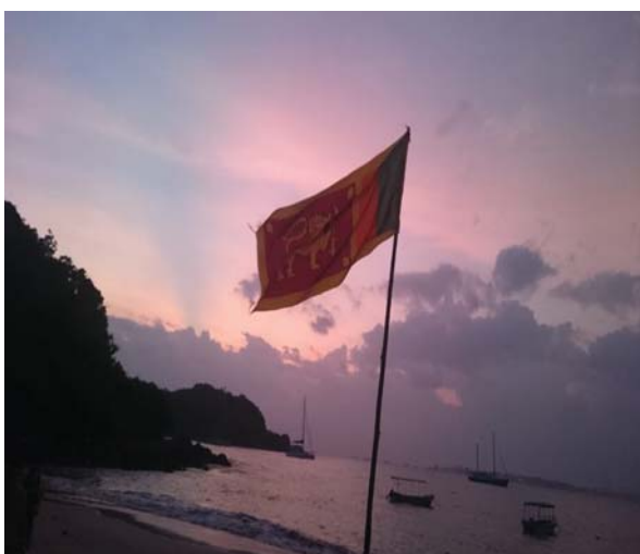
Die Flagge Sri Lankas